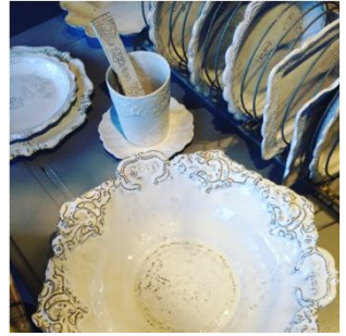
MISS MALA KERAMIK